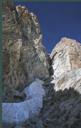
Brecha de Latour