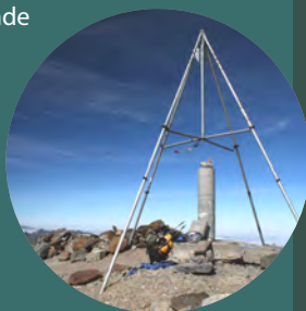
Cima del Balaitús