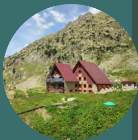
Refugio de Respomuso

Se retorna al refugio de Respomuso por el mismo itinerario.