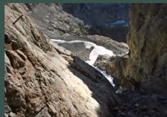
Brecha de Latour

Para los pasos de escalada de la Brecha Latour serán imprescindibles casco, arnés, cabos de anclaje, cuerdas, descensores, mosquetones y material técnico de invierno ( crampones y piolet ), si hay nieve o hielo. Se ha de prestar atención también en el descenso, pues será necesario realizar hasta cinco rápeles para salir del corredor. Existen instalaciones de rápel equipadas. Imprescindible, Informarse en el refugio.