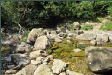
Barranco Gabieto en GR 11