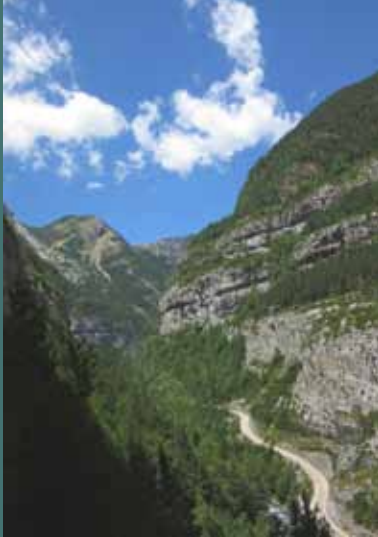
Vista desde el camino de la Escala