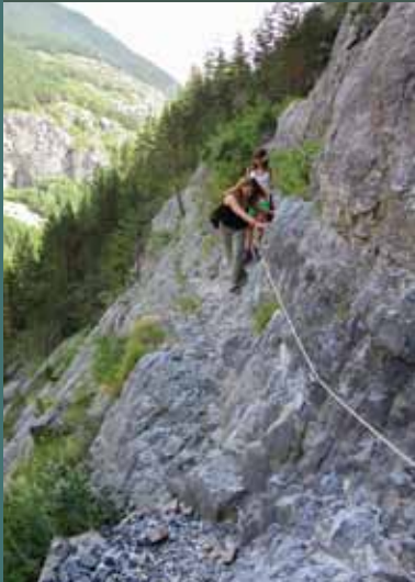
Paso de la Escala