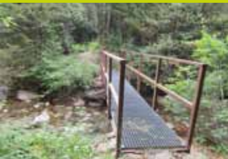
Puente sobre el barranco Gabieto, a 50 m del GR 11

al vadearlo. Existe un puente, 50 m cauce abajo, que permite cruzarlo con seguridad, aunque al estar oculto muchos excursionistas lo desconocen y no lo utilizan.