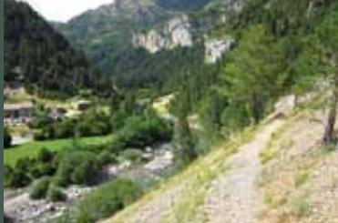
Llegando a Bujaruelo