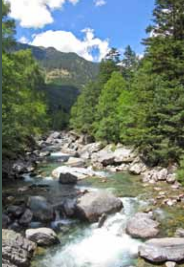
Vista desde el Puente Nuevo