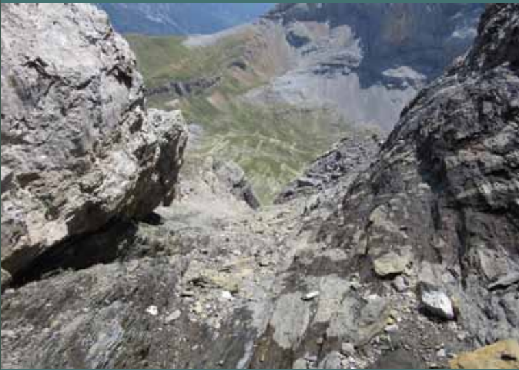
Cadenas en el Paso de las Olas

Sendero de la Faja de las Olas: Mucha precaución en los tramos de pedrizas inestables, los pasos aéreos, gradas, cornisas y los tres tramos equipados con cadenas en la Faja de las Olas y el acceso al collado de Añisclo. Mucha atención en todo momento al estado del suelo para prevenir resbalones y fatales caídas. En el tramo más aéreo y peligroso de la faja superaremos tres tramos sucesivos equipados con cadena pasamanos. El primero, de unos 22 metros, empieza en la trepada de acceso a la canal y va seguido de un segundo tramo horizontal con