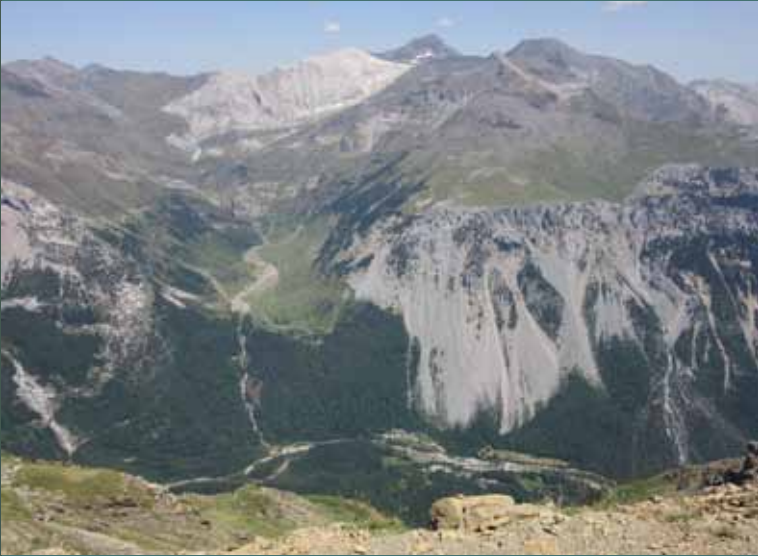
Vistas desde la collada de Añisclo hacia Pineta